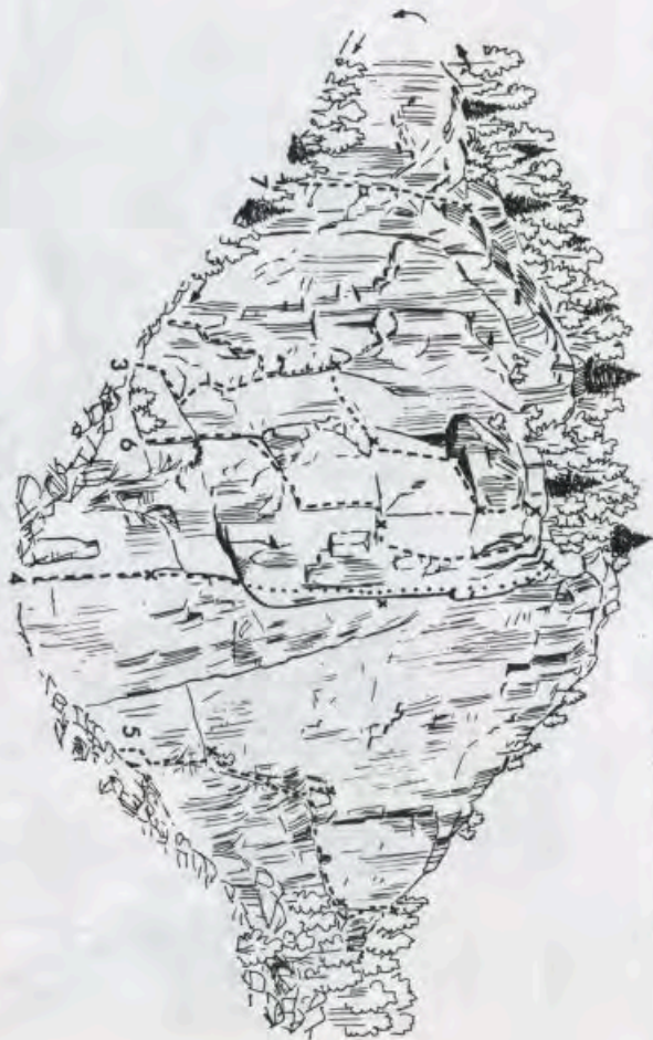
WEIR: "Adagio" (Croquis No 29)

(Il existe une variante au début de la première longueur, un peu plus difficile).