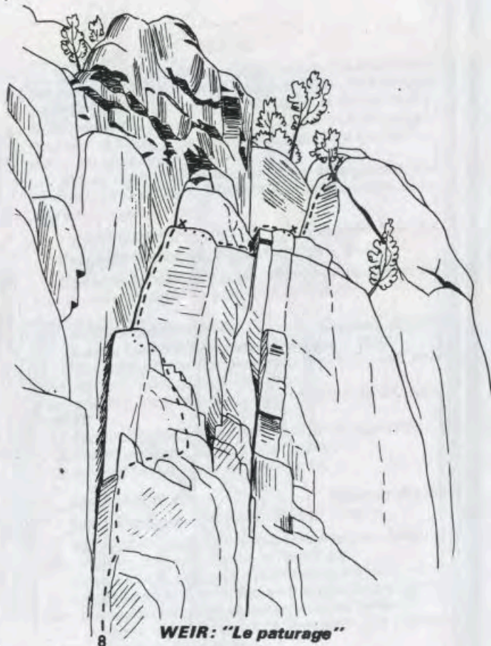
WEIR: "Le pâturage" (Croquis No 31)