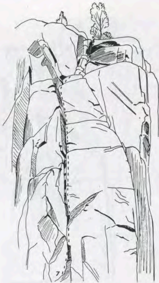
WEIR: "O.N.F." (Croquis No 30)